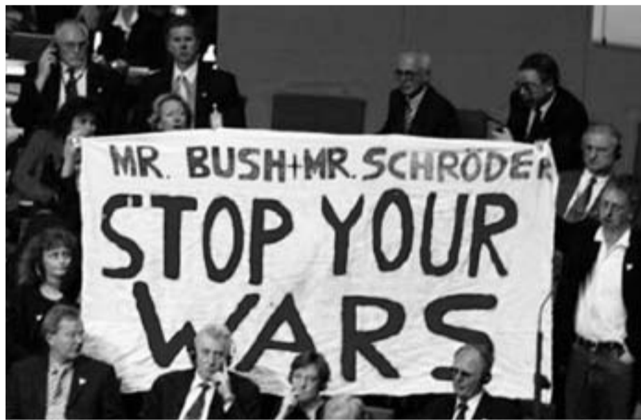
Protest im Bundestag gegen den Besuch von US-Präsident George W. Bush 23.5.2002

Antwort: Die Europäische Union ist aktiv daran beteiligt, dass die Militarisierung in Europa voranschreitet. EU-Kommissionspräsident Juncker und die deutsche Verteidigungsministerin von der Leyen forderten im März 2015 den Aufbau einer EU-Armee. Die deutsche Regierung ist innerhalb der NATO