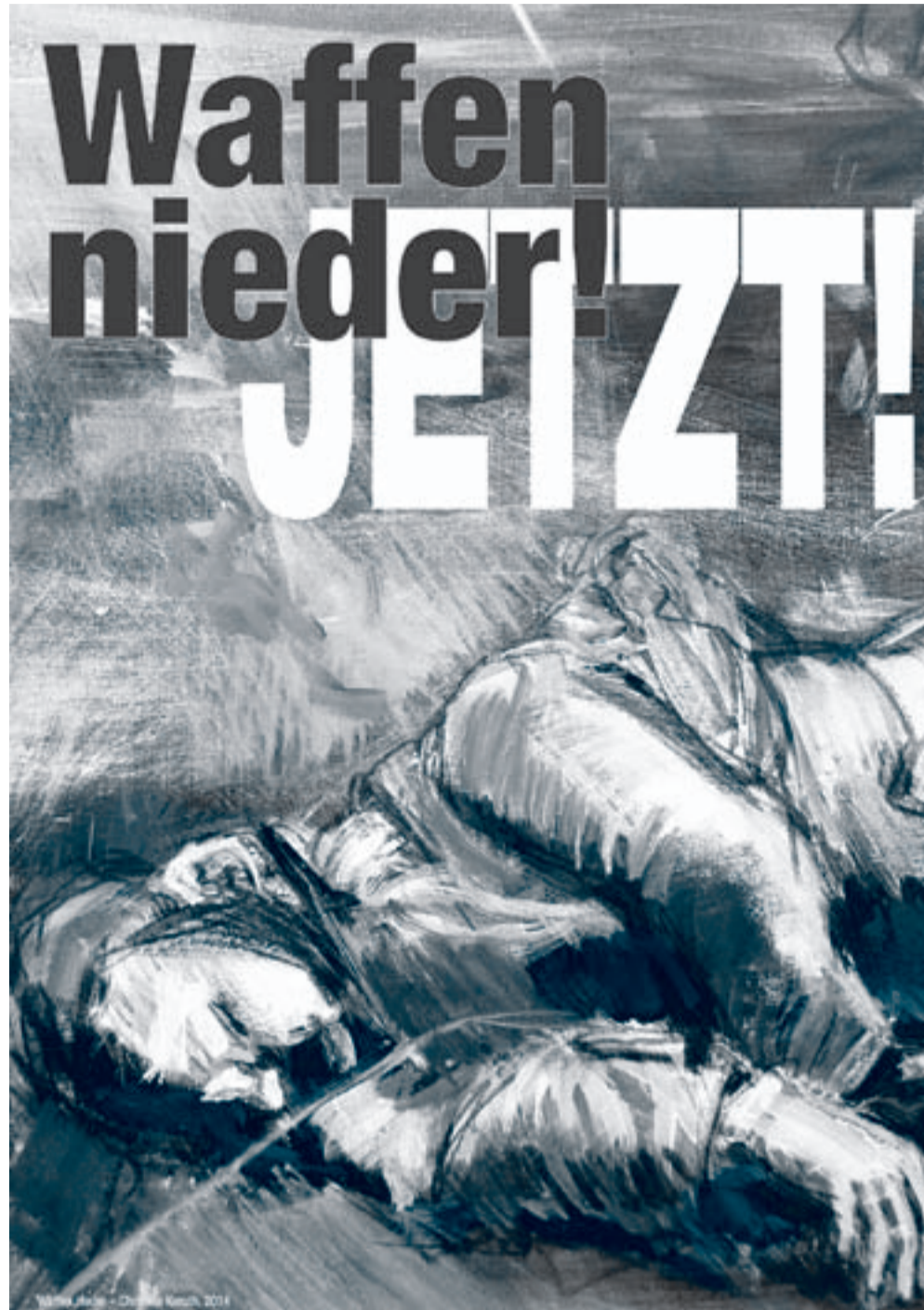
Plakat der Berliner Künstlerin Christine Keruth ( https://keruth.de/ )

liegt ein gigantisches Aufrüstungsprogramm zugrunde, das den von der Regierung formulierten Führungsanspruch in Europa militärisch untermauert. Sie verdoppelt ihren Militärhaushalt innerhalb weniger Jahre. Das bedeutet: sie ist bereit, in naher Zukunft jeden 5. Euro des