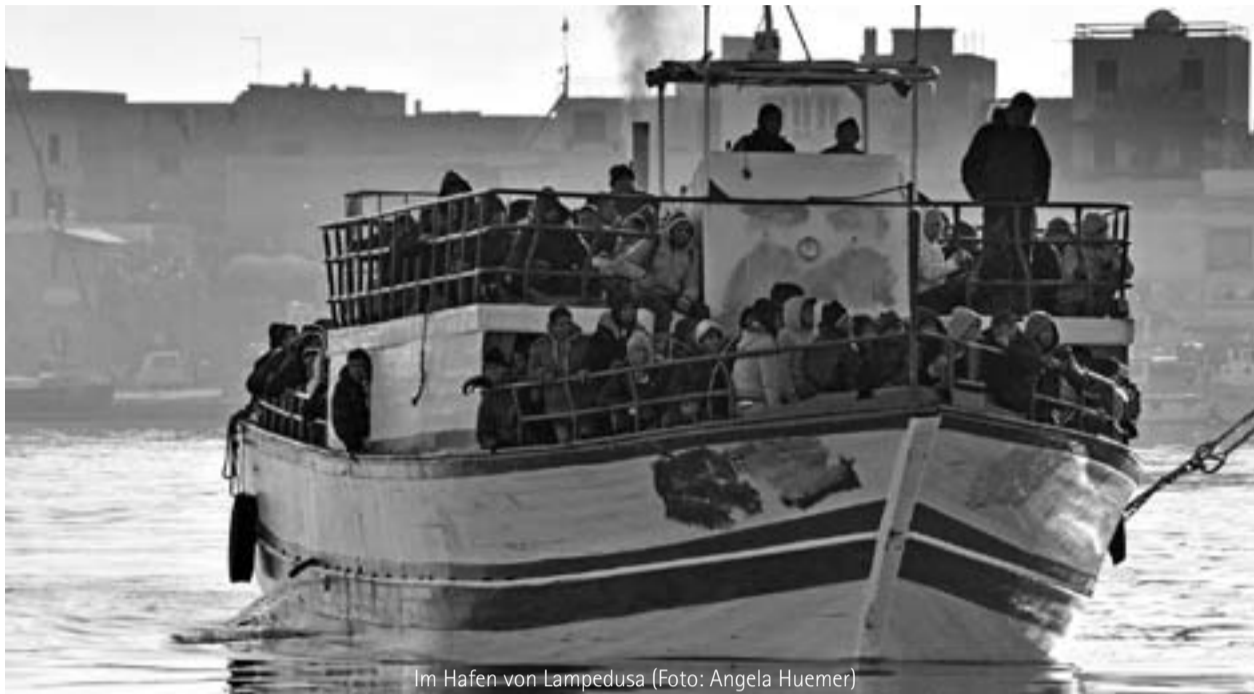
Im Hafen von Lampedusa