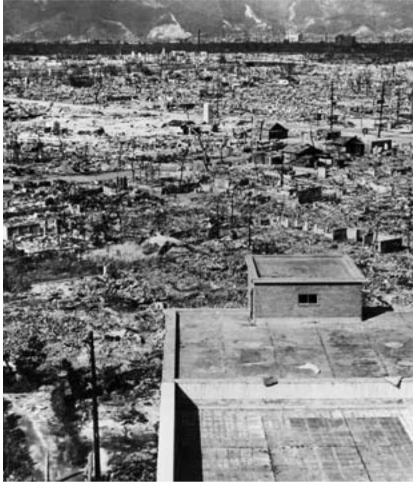
Hiroshima ein paar Tage nach der Atombomben-Explosion am 6. August 1945

über eigene Atombomben. Nach Angaben des schwedischen Friedensforschungsinstituts Sipri haben Russland und USA mit 11.133 Sprengköpfe ca. 90 Prozent aller Atomwaffen, China, Frankreich, Großbritannien, Indien, Israel, Pakistan und Nordkorea kommen zusammen auf über 1.379 A-Bomben. Das historische Jahr 1989, das Ende der zweigeteilten Welt, wurde nicht genutzt, zu einer atomaren Abrüstung zu kommen. Im Gegenteil: Heute scheint eine neue Epoche des atomaren Hochrüstens zu beginnen.