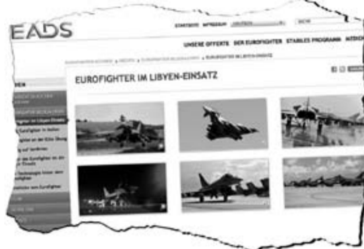
Mahnwache in Bremen für die Ächtung von Atomwaffen im Jahr 2020.

halben Dutzend großer Kriege verteidigt. Letzteres mit den Kriegen in Korea 1950-53, in Indochina 1964-1975, im Irak 1990/91, in Serbien und im Kosovo 1999, in Afghanistan seit 2001 und ein weiteres Mal im Irak 2003. Der größte Erfolg dieser US-Hegemonialpolitik bestand darin, dass 1990/91 die Sowjetunion implodierte, der größte Teil ihrer ehemaligen Bündnispartner, darunter die DDR, dem westlich-kapitalistischen Reich einverleibt und die Nato bis an die Grenzen zu Russland vorrücken konnte. Dass die erwähnten Kriege für die Regierungen in Washington genau die hier zugeschriebene Funktion haben, unterstrich der US-Präsident George Bush senior, als er zum Auftakt des Irak-Kriegs 1990 konstatierte: „We create a new world order“ – Wir zementieren mit diesem Krieg die neue und alte Weltordnung. Einigermassen unerwartet entstand jedoch in den ersten beiden Jahrzehnten des 21. Jahrhunderts eine neue Situation. Der US-Hegemon wird seither von dritter Seite herausgefordert. Und so, wie die Weltwirtschaftskrise der 1930er Jahre als Beschleuniger der neuen Kräfteverhältnisse gewirkt hatte, so wirken die Krisen des 21. Jahrhunderts als Beschleuniger für veränderte Kräfteverhältnisse. Aus der Krise 2007/2008 ging die VR China als Weltexportmeister hervor. Aus der Krise 2020 steigt China zur größten und kreativsten Wirtschaftsmacht der Welt auf. [...]