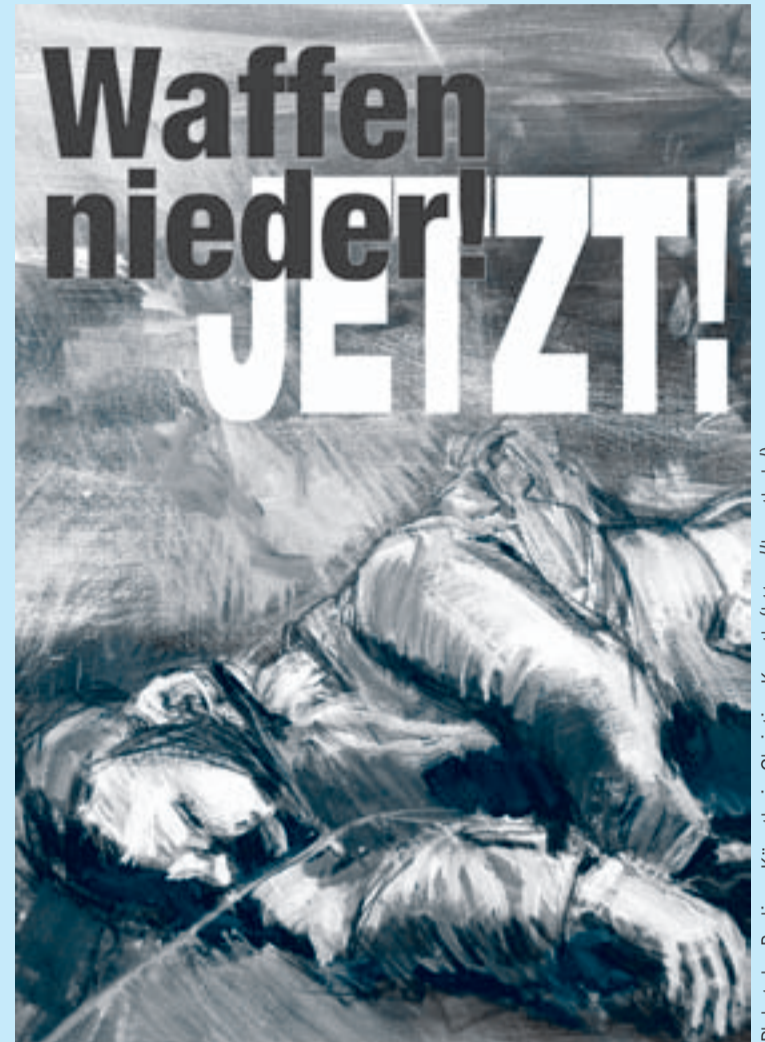
Plakat der Berliner Künstlerin Christine Keruth ( https://keruth.de/ )