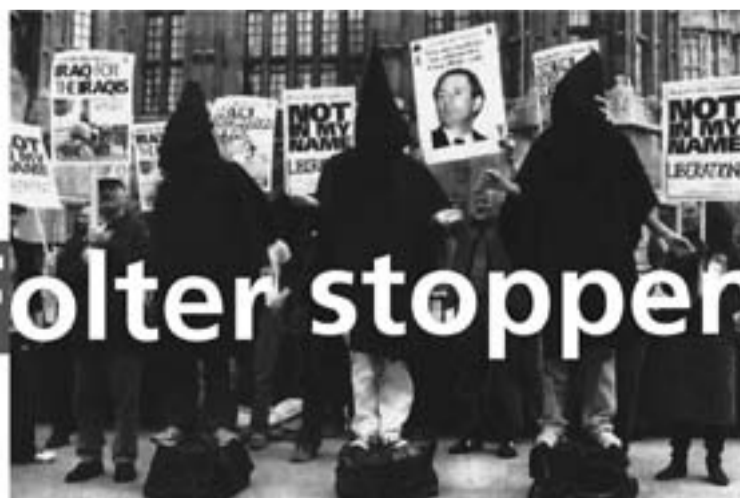
Auf dem Berliner Reichstag, 2. Mai 1945, ZgK-Illustration zu „70 Jahre Ende des Zweiten Weltkrieges“, 2015 · Aufmacher-Grafik zu „Folter stoppen!“ Winter 2005/2006