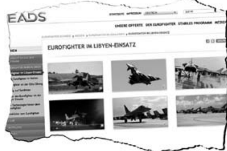
Mahnwache in Bremen für die Ächtung von Atomwaffen im Jahr 2020 · Ausschnitt der Web-Seite des Rüstungskonzerns EADS 2011

halben Dutzend großer Kriege verteidigt. Letzteres mit den Kriegen in Korea 1950-53, in Indochina 1964-1975, im Irak 1990/91, in Serbien und im Kosovo 1999, in Afghanistan seit 2001 und ein weiteres Mal im Irak 2003. Der größte Erfolg dieser US-Hegemonialpolitik bestand darin, dass 1990/91 die Sowjetunion implodierte, der größte Teil ihrer ehemaligen Bündnispartner, darunter die DDR, dem westlich-kapitalistischen Reich einverleibt und die Nato bis an die Grenzen zu Russland vorrücken konnte. Dass die erwähnten Kriege für die Regierungen in Washington genau die hier zugeschriebene Funktion haben, unterstrich der US-Präsident George Bush senior, als er zum Auftakt des Irak-Kriegs 1990 konstatierte: „We create a new world order“ – Wir zementieren mit diesem Krieg die neue und alte Weltordnung. Einigermassen unerwartet entstand jedoch in den ersten beiden Jahrzehnten des 21. Jahrhunderts eine neue Situation. Der US-Hegemon wird seither von dritter Seite herausgefordert. Und so, wie die Weltwirtschaftskrise der 1930er Jahre als Beschleuniger der neuen Kräfteverhältnisse gewirkt hatte, so wirken die Krisen des 21. Jahrhunderts als Beschleuniger für veränderte Kräfteverhältnisse. Aus der Krise 2007/2008 ging die VR China als Weltexportmeister hervor. Aus der Krise 2020 steigt China zur größten und kreativsten Wirtschaftsmacht der Welt auf. [...]