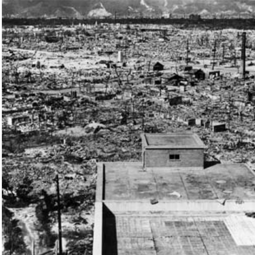
Hiroshima ein paar Tage nach der Atombomben-Explosion am 6. August 1945

über eigene Atombomben. Nach Angaben des schwedischen Friedensforschungsinstituts Sipri haben Russland und USA mit 11.133 Sprengköpfe ca. 90 Prozent aller Atomwaffen, China, Frankreich, Großbritannien, Indien, Israel, Pakistan und Nordkorea kommen zusammen auf über 1.379 A-Bomben. Das historische Jahr 1989, das Ende der zweigeteilten Welt, wurde nicht genutzt, zu einer atomaren Abrüstung zu kommen. Im Gegenteil: Heute scheint eine neue Epoche des atomaren Hochrüstens zu beginnen.